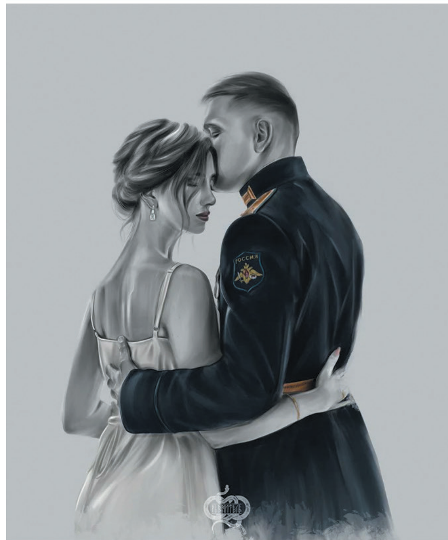
«Опора. Надежда и Вера»

«Любовь к Отчизне и любовь к людям – это два быстрых потока, которые, сливаясь, образуют могучую реку патриотизма» (В.А. Сухомлинский)